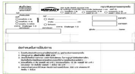
ตัวอย่างบัตรบันทึกเวลาเข้า-ออก

3.1.4 เมื่อส่งสินค้าหรืออุปกรณ์เสร็จเรียบร้อยแล้ว ให้ท่านนำรถของท่านกลับไปจอดที่ลานทะเลสาบ (Lake side หรือ ลาน Pre-Loading หรือให้นำรถออกนอกพื้นที่จุดขนถ่ายสินค้าโดยทันที